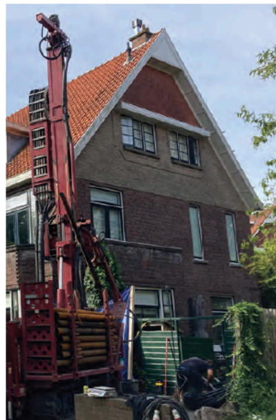
Gevel met boormachine

'Eind november is de gasketel gedemonteerd en is de warmtepomp aangezet. We zijn de winter goed doorgekomen: het comfort is te vergelijken met de situatie met gasketel. Op de convectors op de begane grond en de werkkamer heb ik wel speciale ventilators geïnstalleerd die het vermogen verdubbelen. De warmtepomp maakt maximaal 55 graden cv-water, maar dankzij die ventilators is het in huis even warm als met de cv-ketel op 75 graden. Als back-up hebben we nog onze houtkachel, al bleek die afgelopen winter niet nodig. Een alternatieve (en scho-